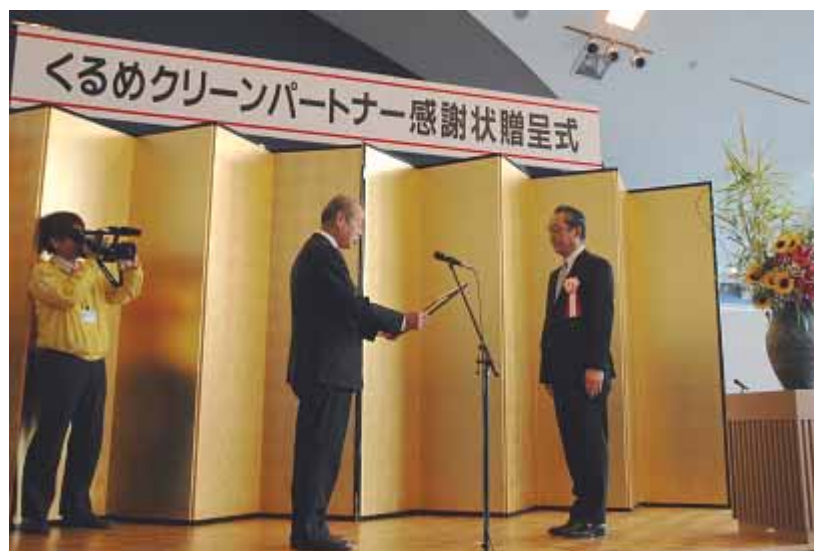
榎原久留米市長（左）より感謝状贈呈