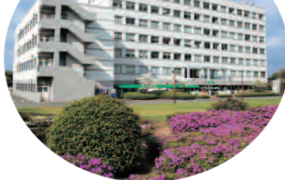
株式会社 ちくぎん地域経済研究所 久留米リサーチセンタービル6階

The Chikugin Research Institute For Regional Economy Co.,Ltd