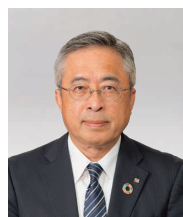
取締役常務執行役員