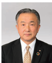
取締役常務執行役員