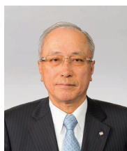
取締役頭取 (代表取締役)