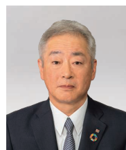
取締役常務執行役員