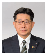
取締役専務執行役員 (代表取締役)