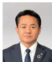
取締役常務執行役員