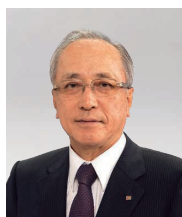
取締役頭取 (代表取締役)