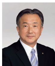
取締役常務執行役員