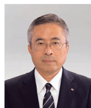
取締役常務執行役員