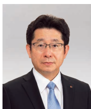
取締役専務執行役員 (代表取締役)