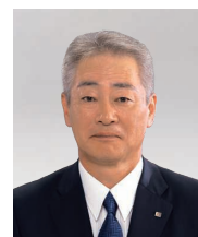
取締役常務執行役員