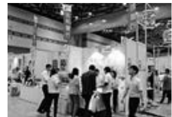
地方銀行フードセレクション

■これから海外でビジネスをお考えのお客さま、すでにビジネスを展開中のお客さまを専門部署、業務提携先等とともに支援しております。