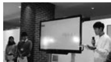
グローバル・キャリア講座