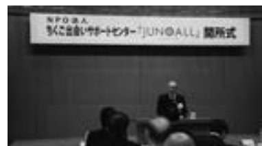
「ちくご・ジュノール」

日本の少子高齢化問題を解決し、地域活性化にも貢献することを目的に立ち上げられた非営利目的の婚活支援組織。福岡県南地域においても「ちくご・ジュノール」が2019年5月より事業開始。