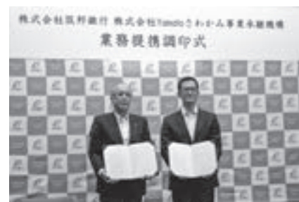
Yamatoさわかみ事業承継機構と業務提携調印

また、今後を担う若手経営者・後継者に必要な経営者としてのスキルや具体的行動に役立つノウハウを学ぶことができる「ちくぎん未来創造経営塾」を開催しております。