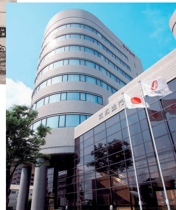
現在の本店（平成元年9月新築移転）