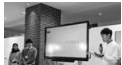
第4回グローバル・キャリア講座 （2019年10月～2020年1月）