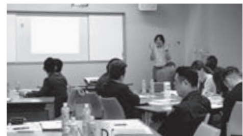
ちくぎん未来創造経営塾（第4期 2019年9月～2020年2月）

また、今後を担う若手経営者・後継者に必要な経営者としてのスキルや具体的行動に役立つノウハウを学ぶことができる「ちくぎん未来創造経営塾」の第4期を開講いたしました。