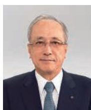
取締役頭取 (代表取締役)