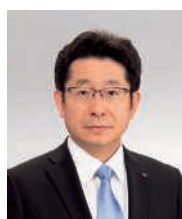
取締役常務執行役員