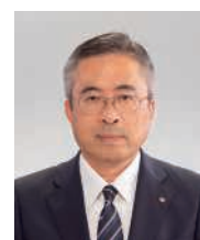
取締役常務執行役員