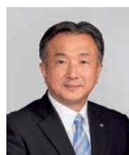
取締役常務執行役員