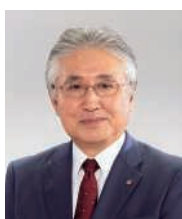
取締役専務執行役員 (代表取締役)