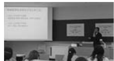
久留米大学にて講義 （グローバル・キャリア講座 2018年10月）