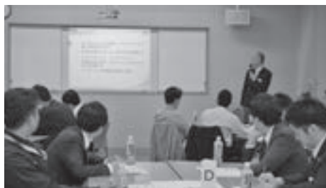
ちくぎん未来創造経営塾（第3期 2018年9月～2019年2月）

また、今後を担う若手経営者・後継者に必要な経営者としてのスキルや具体的行動に役立つノウハウを学ぶことができる「ちくぎん未来創造経営塾」の第3期を開講いたしました。