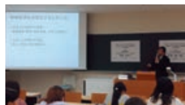
久留米大学にて講義 （グローバル・キャリア講座 2018年10月）