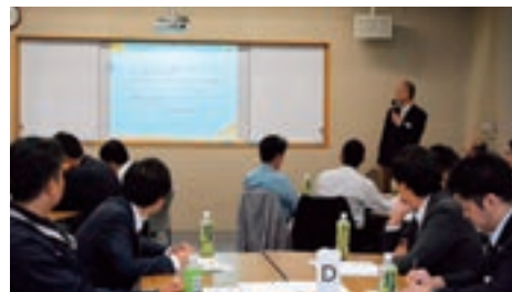
ちくぎん未来創造経営塾（第3期 2018年9月～2019年2月）

また、今後を担う若手経営者・後継者に必要な経営者としてのスキルや具体的行動に役立つノウハウを学ぶことができる「ちくぎん未来創造経営塾」の第3期を開講いたしました。