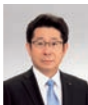
取締役常務執行役員 (企画本部長)