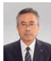
取締役常務執行役員