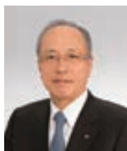
取締役頭取 (代表取締役)