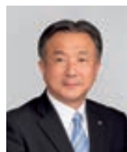
取締役常務執行役員 (営業本部長)