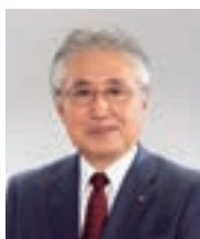
取締役専務執行役員 (代表取締役)