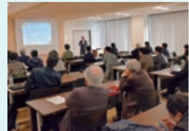
大学発ベンチャーセミナー

本セミナーでは、久留米工業大学の有する知識・技術を大学発ベンチャーとして創出・成長させるための環境やトレンドを共有し、将来的に新規事業創出を目指すための課題を考えました。当行では、新規事業創出にあたり金融ノウハウや投融資を含めた金融面での支援を行ってまいります。