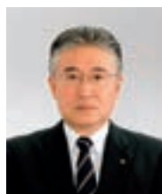
取締役常務執行役員