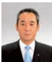
取締役常務執行役員