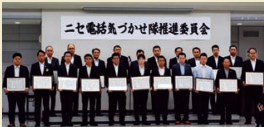
二セ電話気づかせ隊団体表彰式

「二セ電話気づかせ隊」は、平成27年6月に特殊詐欺被害が急増していることを受け、福岡県警察が民間企業や団体などに呼びかけ、被害を防止するために発足し、当行も推進委員として参加しております。平成30年5月には、当行が二セ電話詐欺の被害防止に貢献したとして、表彰を受けました。今後も、お客さまへの積極的な声かけ、防犯チェックを実施してまいります。