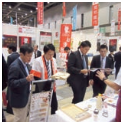
地方銀行フードセレクション 2016