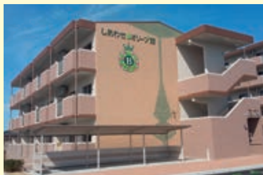
オリーブ館（佐賀県みやき町）