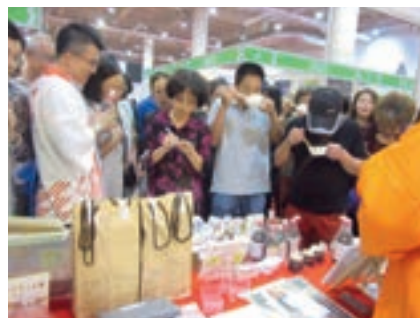
大連日本商品展覧会（中国大連市）