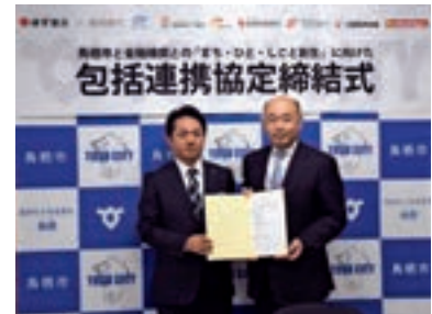
鳥栖市との包括連携協定

さらに、地域活性化をより支援していくため、平成28年2月に久留米市、日田市、11月に鳥栖市と包括連携協定を締結いたしました。加えて、「久留米市まち・ひと・しごと創生会議」等の委員に当行役職員が就任するなど、地方創生に積極的に参画しております。