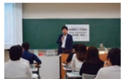
「地域創生への貢献」について講義 (久留米大学)