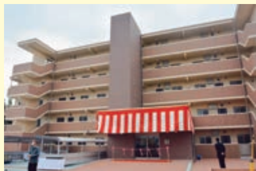
スカイラーク菊池（福岡県大刀洗町）