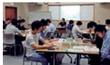
若手行員を中心とした行内塾