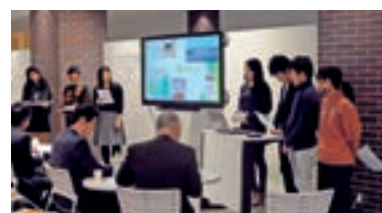
学生によるプレゼンテーション （グローバル・キャリア講座 平成29年1月）