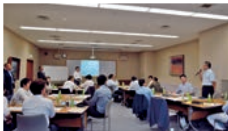
ちくぎん未来創造経営塾（第1期 平成29年1月～6月）