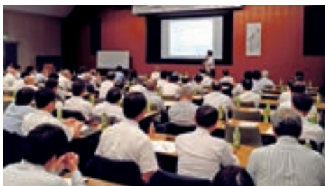
事業承継セミナー（平成28年8月）

また、今後を担う若手経営者・後継者に必要な経営者としてのスキルや具体的な行動に役立つノウハウを学ぶことができる「ちくぎん未来創造経営塾」を開講いたしました。