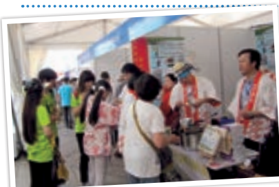
第二回日本商品大連地区巡回展