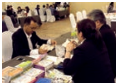
福岡県タイビジネス訪問団（ビジネス交流会）