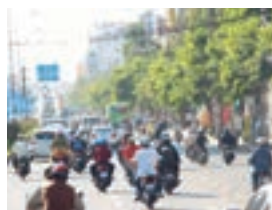
ホーチミンの市街

平成29年2月、ベトナム経済視察団を組成し、ベトナム最大の商業都市として栄えるホーチミン市を中心に経済視察を行いました。視察には、当行のお取引先にも多数参加いただきました。