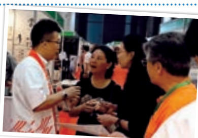
2016 (第八回) 大連日本商品展覧会