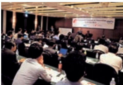
2017年ベトナムICTセミナー&ネットワーキング in FUKUOKA