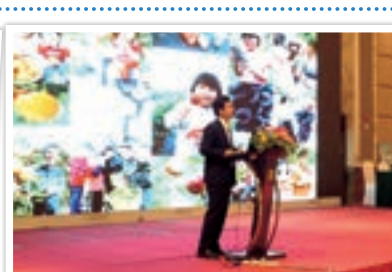
中日観光大連ハイレベルフォーラム