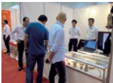
2016 (第八回) 大連日本商品展覧会