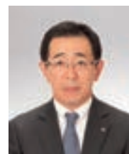
常務取締役 (営業統括部長)