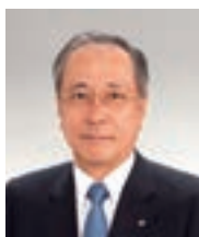
取締役頭取 (代表取締役)