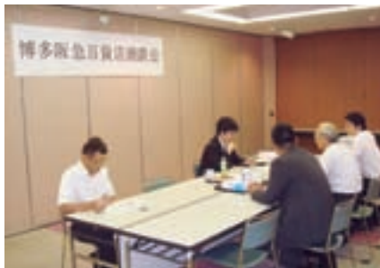
博多阪急百貨店商談会

当行、佐賀銀行および十八銀行の3行で設立した「北部九州ビジネスマッチング協議会」は、お取引先の販路拡大等のご支援、地域経済の活性化を図ることを目的に、コンビニ、百貨店など多くのバイヤーを招聘し、商談会を開催しております。