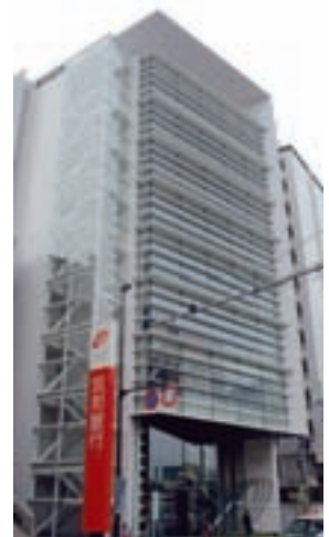
ちくぎん福岡ビル

両店舗はお客様の大切な財産を安全にお守りする全自動貸金庫やご相談コーナーの設置など機能面を充実させております。設備面でも太陽光発電システムやLED照明を導入した環境配慮型（エコ）店舗となっております。また、高齢者や車イス使用者の方にも安全にご利用いただけるようにバリアフリーを採用いたしております。