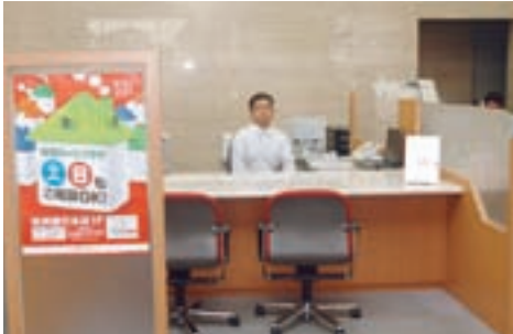
本店営業部1階住宅ローンプラザ

昨年10月に本店営業部1階に、昨年11月には新規開店した千早支店に「住宅ローンプラザ」を開設いたしました。「住宅ローンプラザ」では、土日（祝日・振替休日および国民の休日は除きます）も住宅ローン、マイカーローン、などのご相談を承っております。