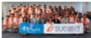
博多どんたく港まつり「どんたく広場パレード」

本年5月3日（木）に開催された、博多どんたく港まつり「どんたく広場パレード」に初めて参加し、約1.27kmを「久留米そばん踊り」を披露しながらパレードいたしました。