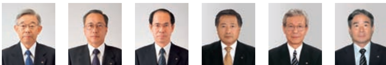
取締役会長 (代表取締役)