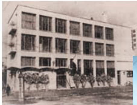
旧本店（昭和28年12月竣工）

当行創立の時期の産業界は、戦後の復興に多くの資金を必要としていました。しかし、福岡県南部の中小企業の皆さまは復興資金の調達さえ苦しく、資金繰りは厳しいものでした。そこで金融難の打開策として県南部の商工会議所等を中心に地元銀行設立の機運が起こり、本店を久留米市として設立されたのが「筑邦銀行」です。