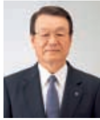
取締役頭取 (代表取締役)