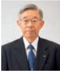
取締役会長 (代表取締役)